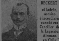
BECKER el ladrón, asesino incendiario, el Canciller de la Legación Alemana en Chile.